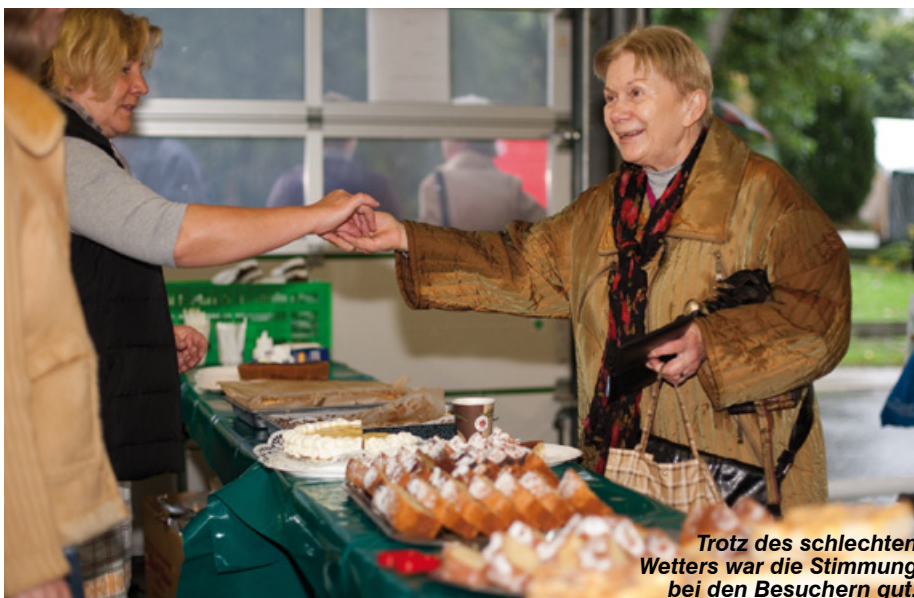
Trotz des schlechten Wetters war die Stimmung bei den Besuchern gut.