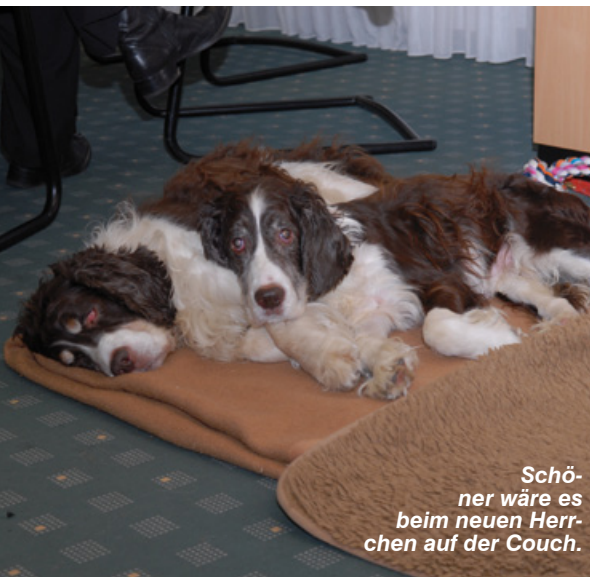
Schöner wäre es beim neuen Herrchen auf der Couch.

oft ausgesetzt oder ins Tierheim gebracht. Im besten Fall bekommen wir die Tiere bevor sie Schaden genommen haben. In schlimmeren