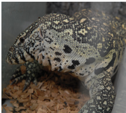
Nils ist jetzt noch 90 cm lang, ausgewachsen kann er 2,50 Meter erreichen.

oft ausgesetzt oder ins Tierheim gebracht. Im besten Fall bekommen wir die Tiere bevor sie Schaden genommen haben. In schlimmeren