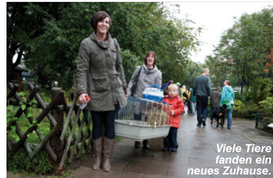
Viele Tiere fanden ein neues Zuhause.

Neben diesen vielen tierischen Eindrücken gab es bei einer gut bestückten Tombola auch attraktive Sachwerte zu gewinnen. So konnten die Loskäufer mit ein bisschen