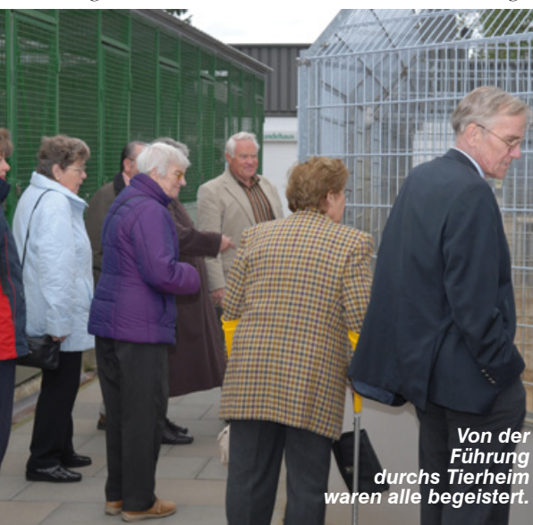
Von der Führung durchs Tierheim waren alle begeistert.