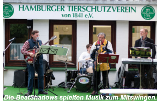
Die BeatShadows spielten Musik zum Mitswingen.