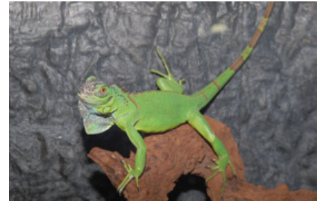
Pablo hat ein Zuhause gefunden.

Auch im Tierheim stellt uns der Anstieg an Reptilien vor viele Probleme. Die Tierpfleger brauchen regelmäßige Schulungen, damit die immer neuen Arten, die wir bekommen, artgerecht gehalten und versorgt werden. Auch unsere Tierärzte müssen immer auf dem neuesten Stand sein, denn