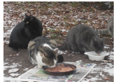
An Futterstellen können die frei lebenden Katzen am Besten eingefangen werden.

Mit tierfreundlichen Grüßen zum Weihnachtsfest und zum Jahreswechsel, Ihr Manfred Graff