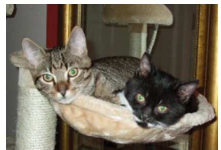
Vermittlungserfolg: Fin und Ida haben ein gemütliches Plätzchen gefunden.